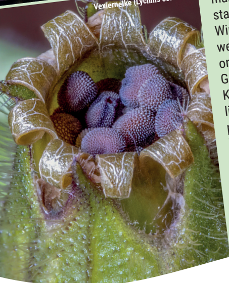
Vexiernelke ( Lychnis coronaria )

Der Arbeitskreis des Stadtmarketings Natur und Umwelt startet eine Saatgutbibliothek. Wir möchten gerne, dass auch weiterhin alte und an ihre regionalen Standorte angepasste Gemüsesorten, Blumen und Kräuter als Samen frei zugänglich sind. Unsere Pflanzen produzieren jedes Jahr soviel im Übermaß, dass die Menge für den eigenen Garten oder Balkon sowieso zu viel ist.