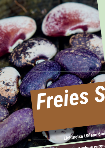
Lichtnelke ( Silene dioica )